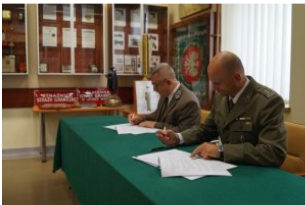
Podpisanie porozumienia z Regionalną Dyrekcją Lasów Państwowych w Krakowie